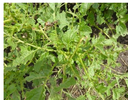
Blattfraß durch Kartoffelkäfer und deren Larven