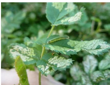
Skelettierfraß an Rosenblättern durch Larven von Blattwespen