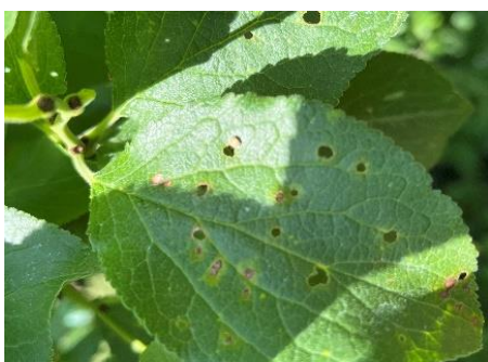
Lochbildung durch die Schrotschusskrankheit an Steinobst