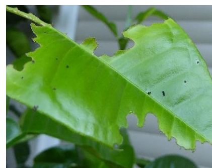
Blattverlust durch Raupenfraß - Kotkrümel erkennbar