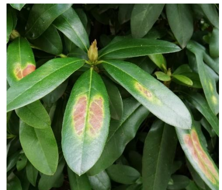
Sonnenbrand auf Rhododendronblättern nach Gehölzrückschnitt