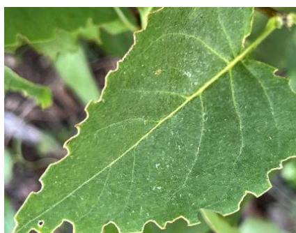
Buchtenfraß an Blättern von Gehölzen durch Rüsselkäferarten