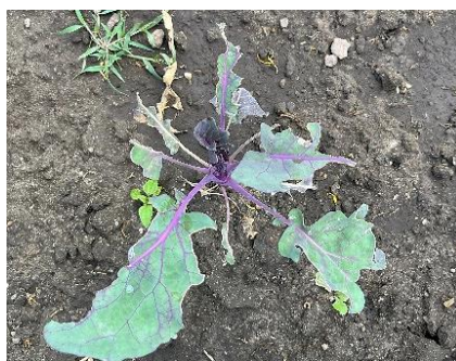
Vogelfraß an Kohlrabi blättern