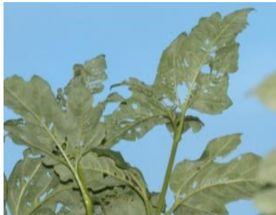
Aufgerissene, löchrige Blätter an Triebspitzen nach heißen Tagen durch Blattwanzen