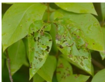
Löcher im Blatt nach Befall durch die Schrotschuss-Pilzkrankheit

An Gehölzen können aber auch Pilzkrankheiten wie die Schrotschusskrankheit eine sporadisch auftretende Löcherung der Blätter an Kirschen-Arten, Pfirsichen und Kirschlorbeer verursachen. Die Infektion ist von speziellen Witterungsbedingungen abhängig und für die Gehölze nicht bedrohlich.