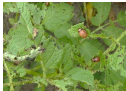
Kartoffelkäferlarven beim Fraß

An Gehölzen können aber auch Pilzkrankheiten wie die Schrotschusskrankheit eine sporadisch auftretende Löcherung der Blätter an Kirschen-Arten, Pfirsichen und Kirschlorbeer verursachen. Die Infektion ist von speziellen Witterungsbedingungen abhängig und für die Gehölze nicht bedrohlich.