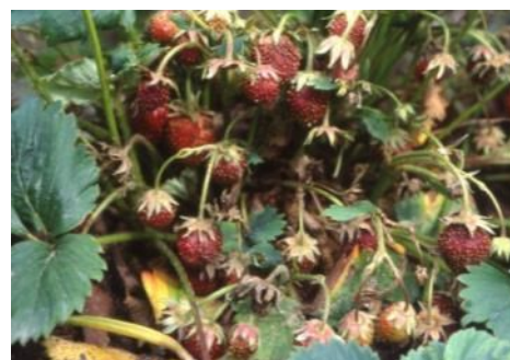
Kleine, ledrige Früchte

Pilze sein, die die Wurzeln schädigen und in den Zentralzylinder eindringen, sodass die Erdbeerpflanzen nicht mehr ausreichend Wasser aufnehmen können. Sie vertrocknen von innen heraus. Hohe Temperaturen und ein Zuviel an Bodenfeuchte (zurzeit durch übermäßiges Gießen) fördern den Befall.