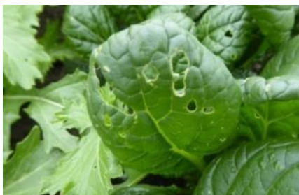
Fraß von Blattflohkäfern an Gemüseblättern