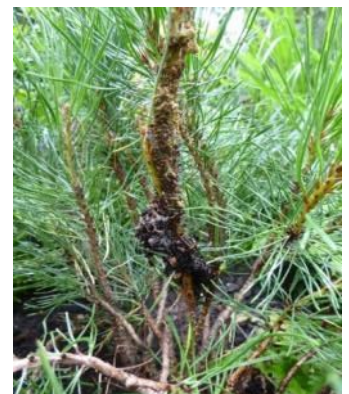
Larven der Kiefernkultur-Gespinstblattwespe in mit Kot gefülltem Gespinst

...werden durch die Kiefernkultur-Gespinstblattwespe hervorgerufen. Im Moment können an den Trieben Verdickungen / Gespinste, die mit Kot gefüllt sind, erkannt werden. Im Inneren leben Larven, die die Kiefernadeln fressen. Dadurch wird das Wachstum der langsam wachsenden Gehölze beeinträchtigt. Die Insekten überdauern den Winter im Boden. Deshalb müssen jetzt die verdickten Triebe gemeinsam mit den Larven entfernt werden, um ein dauerhaftes Etablieren am Standort zu unterbinden.