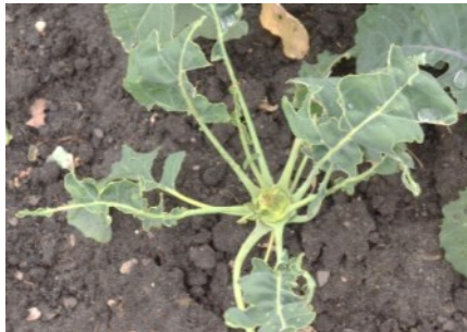
Blattskelettierung durch Vögel am Kohlrabi

An sehr vielen Pflanzenarten, sowohl an Gehölzen als auch an Stauden, Gemüse und Kräutern, können jetzt Blattschäden in Form von Löchern, Blattskelettierung oder auch Deformationen festgestellt werden. Die Ursachen sind sehr unterschiedlich, sie können oftmals nicht eindeutig zugeordnet werden. Um das Risiko für die Pflanzen einzuschätzen, ist es aber wichtig, die Ursachen zu identifizieren. In vielen Fällen können die Pflanzen den Blattverlust ohne nachhaltige