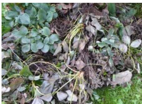
Welke, an den jungen Blättern beginnend

Heute noch leckere Erdbeeren geerntet – morgen schon welke Pflanzen. Die Früchte bleiben klein und unreif, werden gummiartig und schmecken bitter. Ursache können verschiedene bodenbürtige