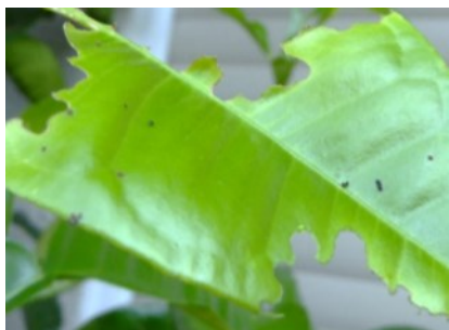
Fraß von Schmetterlingsraupen

Blattmasse benötigen pflanzenfressende Insekten direkt für ihre Entwicklung und somit fressen sie Pflanzen auf. Bekannt sind Schäden durch Käfer und ihre Larven wie vom Kartoffelkäfer, diverse Blattkäfer-Arten (Lilien- und Spargelhähnchen), Blattflöhe an Gemüse, Rüsselkäfer, auch Raupenfraß von Schmetterlingen und Blattwespen. Hier ist der Schaden für Pflanzen von der Insektenart und den begleitenden Umständen abhängig und muss sehr individuell eingeschätzt werden.