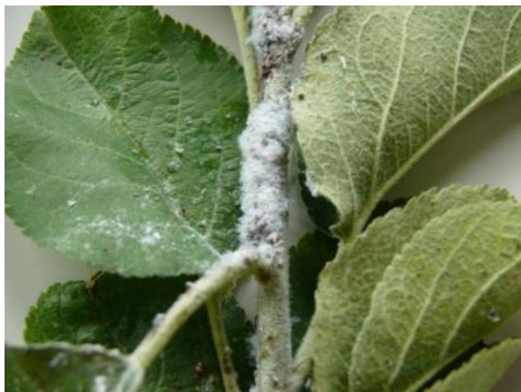
Blutläuse an Apfeltrieb

Zurzeit fallen weiße flockige Wachausscheidungen an Apfelbäumen auf, besonders häufig an Stammaustrieben, an jungen Trieben und Schnittwunden.